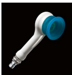
ПВМ – насадка для подводного вакуумного массажа