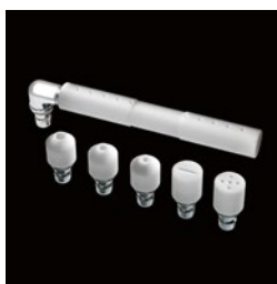
РГМ – насадка для подводного ручного гидромассажа