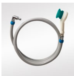
Шланг для насадок РГМ и ПВМ